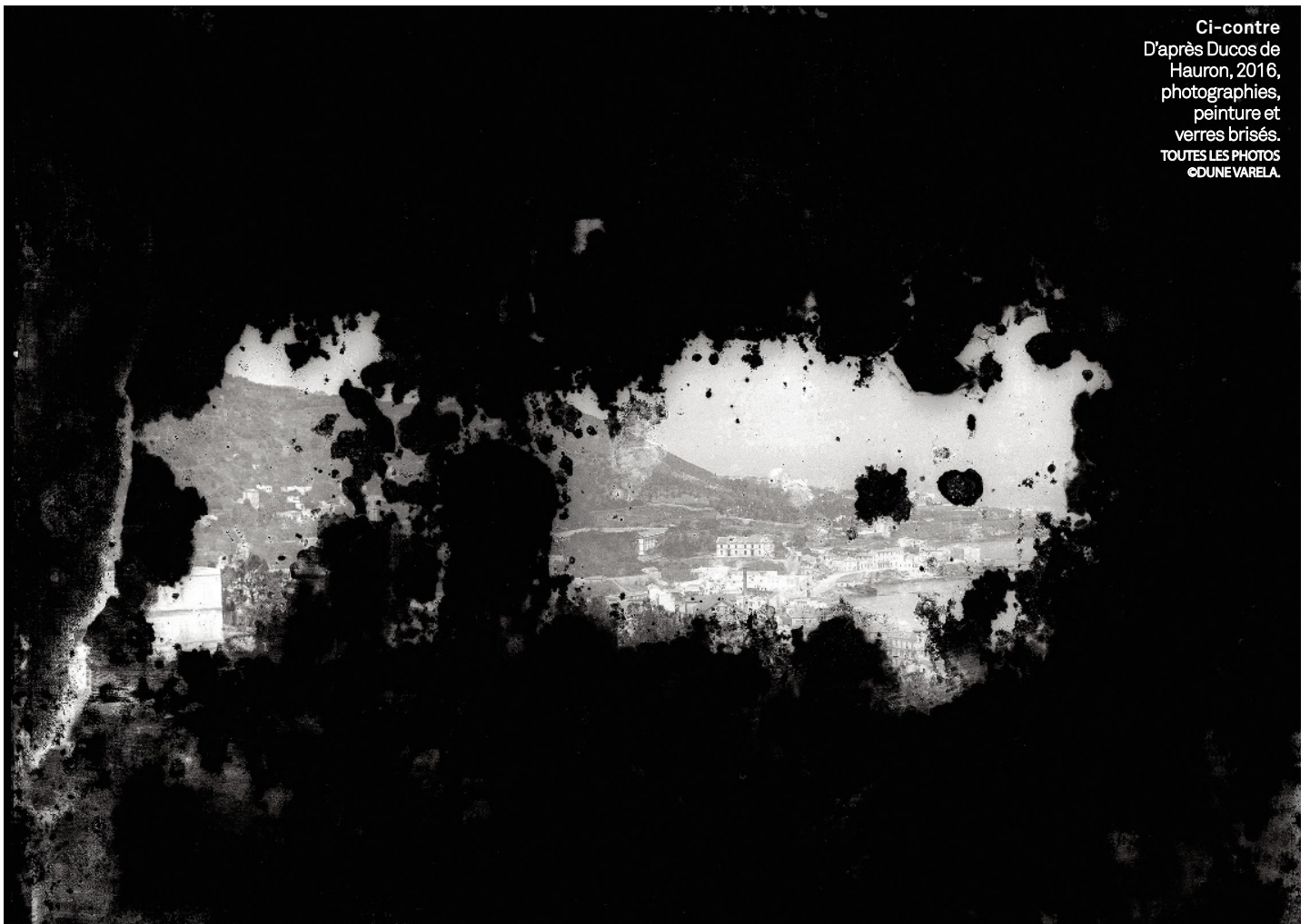
Ci-contre D'après Ducos de Hauron, 2016, photographies, peinture et verres brisés.