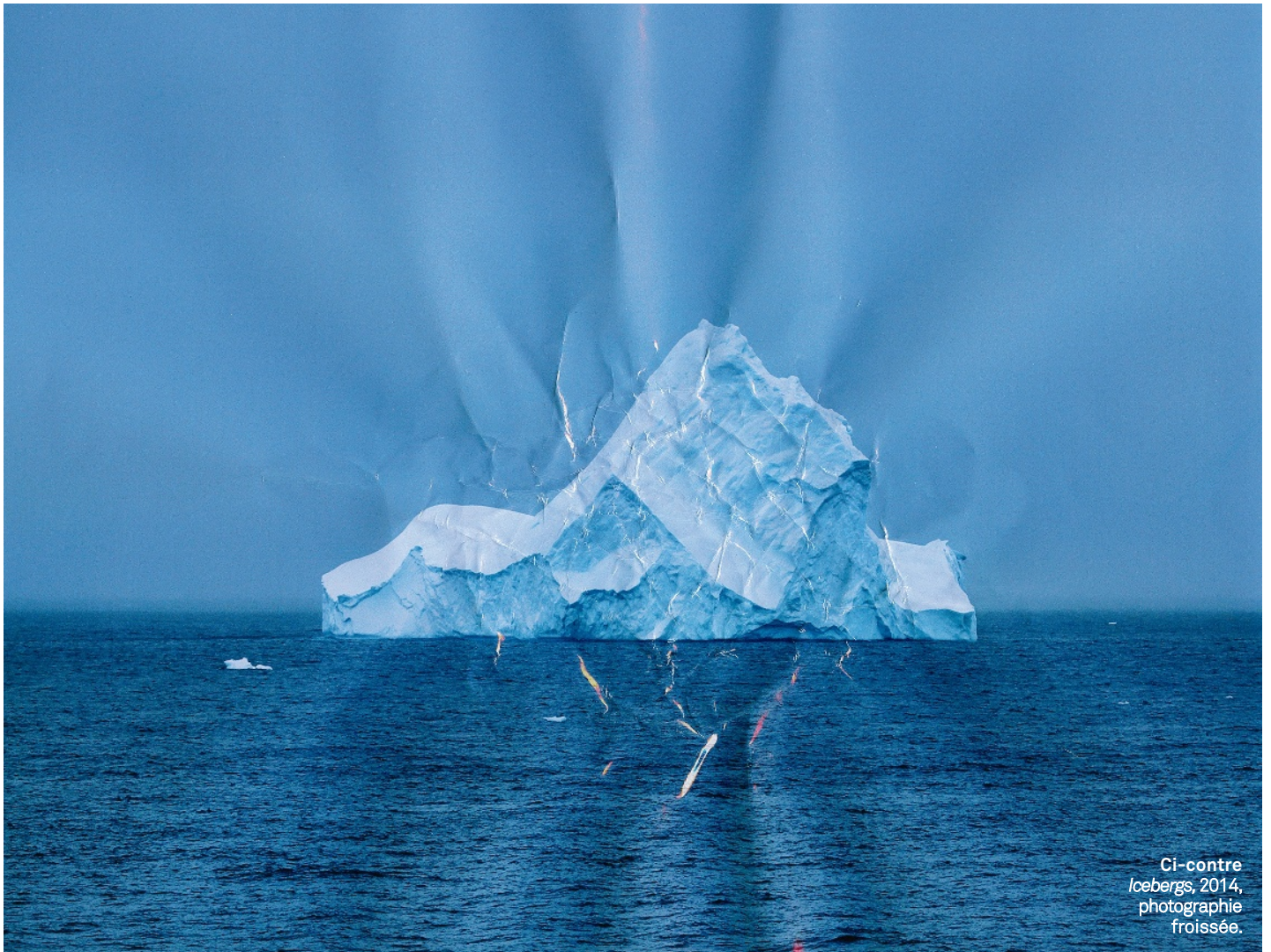
Ci-contre Icebergs, 2014, photographie froissée.